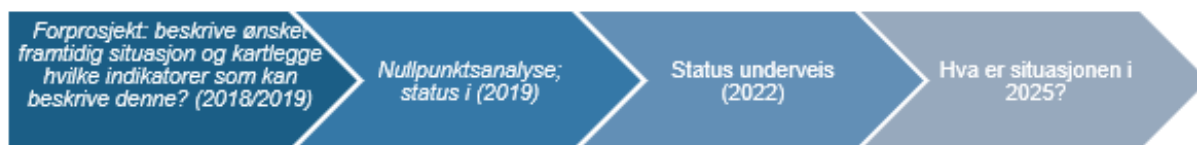
Figur 2 Forslag til evalueringsløp

I det videre arbeidet må det etableres gode rapporteringsrutiner for de indikatorene som skal brukes til å etablere en baseline og senere si noe om status etter myndighetsoverføringen. Det må også tas en beslutning sentralt om hvor ofte indikatorene bør måles, og hvor ansvaret for å følge gevinstene skal plasseres. Det må også tas beslutninger om og etableres rutiner for hvordan dataene skal lagres og publiseres.