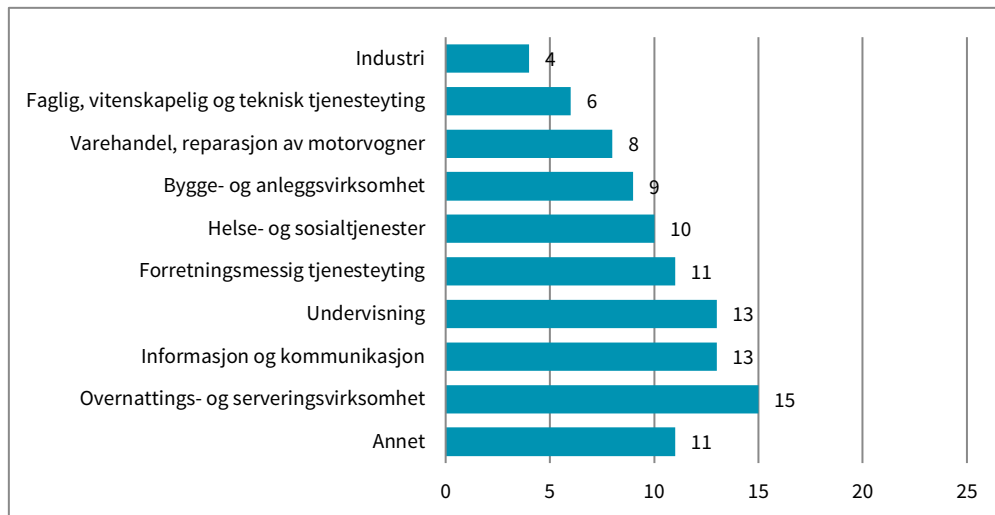
Figur 1.1 Bosatte arbeidstakere fra tredjeland, første år i Norge 2015–2018, i jobb 4. kvartal 2018, innvandret pga. arbeid. Etter hovednæring. Prosent (N = 9068)

Sysselsettingsstatistikken fra SSB 6 kan fortelle mer om hvilke bransjer arbeidsinnvandrerne jobber i, og hvor mange som er sysselsatt på gitte tidspunkter. I figur 1.1 vises arbeidstakere fra tredjeland som er registrert med første år i Norge i perioden 2015–2018, og som var i jobb fjerde kvartal 2018. Arbeidstakere som er kommet til landet på grunn av utdanning, og som senere har gått over i arbeid, er ikke tatt med i tallene.